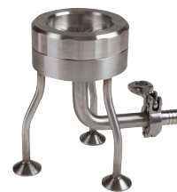
アイソレータサンプ リングキット