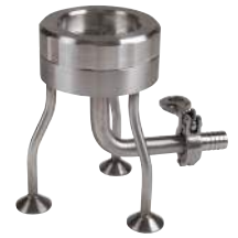
アイソレータサンプリングリングキット