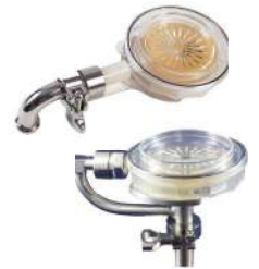
リモートサンプリングヘッド接続キット