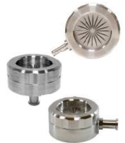
BioCaptサンプリングヘッド