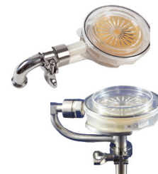
リモートサンプリング ヘッド接続キット