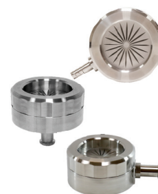
BioCaptサンプリング ヘッド